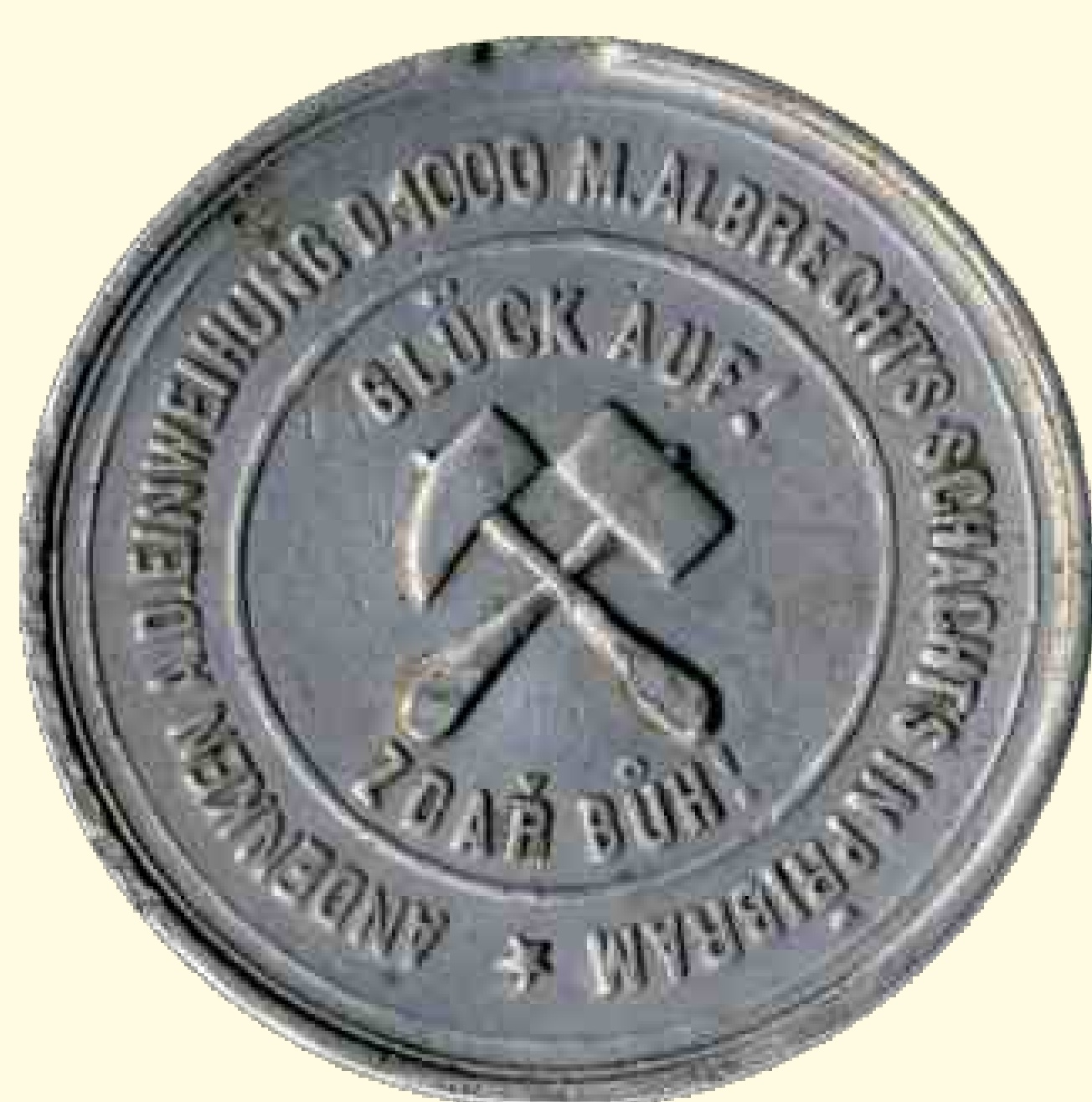
After the guests' delegation ascended back to the surface on 14 th September 1875, the thank was given to the officers and miners of the Příbram mining enterprise for reaching an important work success; they were also handed over the memorial medals. On the medal obverse side there is a picture of St. Barbara, the Patron Saint of Miners, on the reverse side there is a mining symbol in the shape of the crossed pick and hammer and the Czech-German text: "The memory of consecration of 1 000 m Albrecht mine (correctly it should be Adalbert) in Příbram, Bless the Lord".