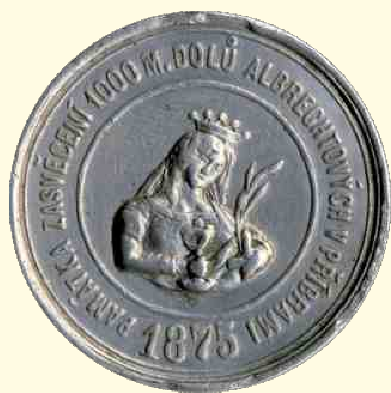
Po vyfárání delegace hostů na počtvrt 14. 9. 1875 následovalo poděkování úředníkům a horníkům příbramského horního závodu za dosažení významného pracovního úspěchu a také předání pamětních medailí. Medaile má na lici vyobrazení patronky horníků sv. Barbory, na rubu hornický znak v podobě zkříženého železíka a mlátky a česko-německý text: „Památku zasvěcení 1 000 m dolů Albrechtových (správně by mělo být Adalbertových) v Příbrami, Zdař Báh“.

The guests of honour also got the commemorative record.