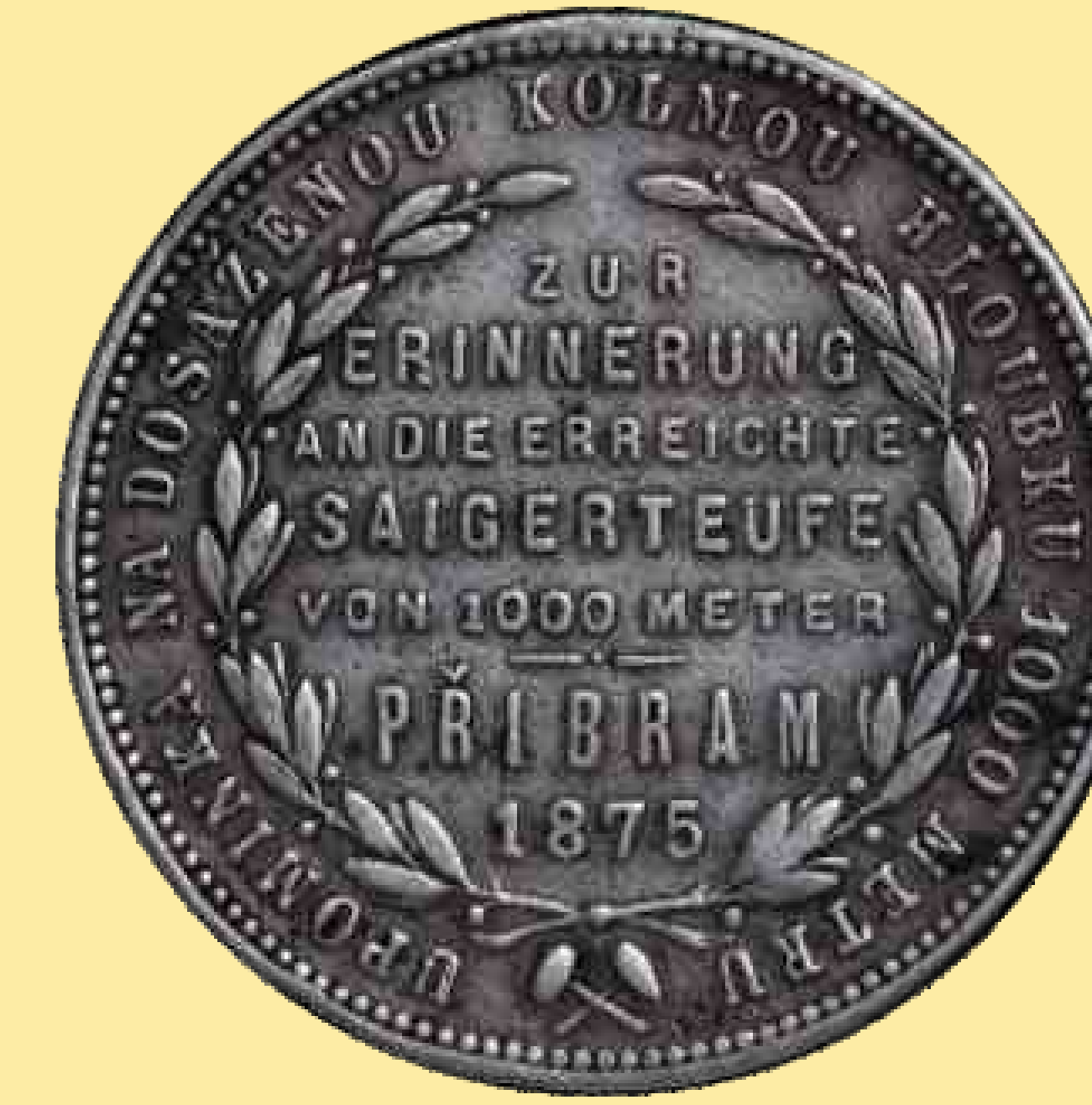
On 14 th September 1875 the mine management gifted the miners with the so-called Příbram memorial silver coin in the value of one golden guilder as a manifestation of appreciation for the performed work. On the coin obverse side there is a portrait of the Emperor Franz Joseph I., on the reverse side of the coin there is the Czech-German text, which was used for the first time: "Commemoration of reaching the vertical depth of 1 000 m, Příbram 1875".