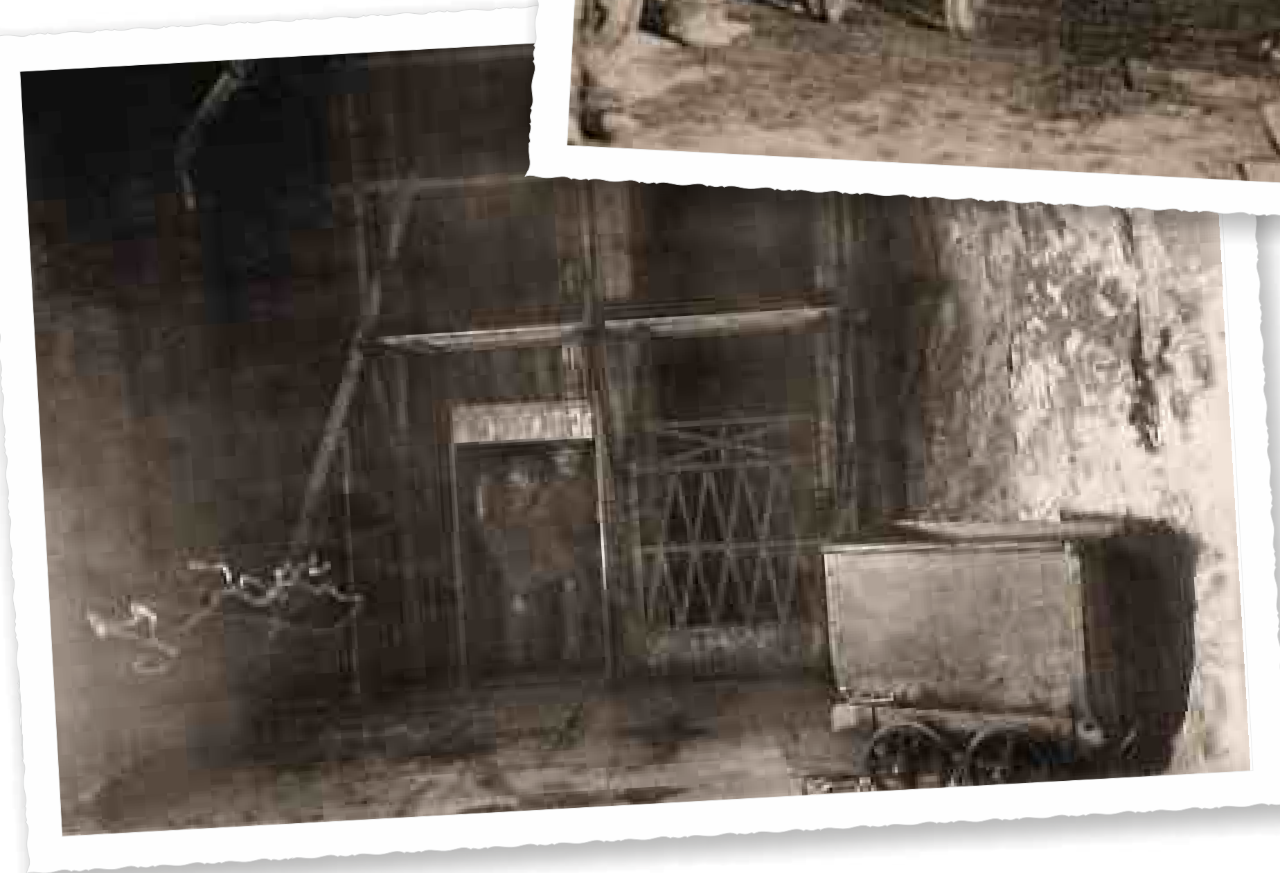
Výjezd horníků v kleci z březohorského dolu koncem 19. století.

The miners in the cage, coming out of the Březové Hory mine in the end of the 19 th century.