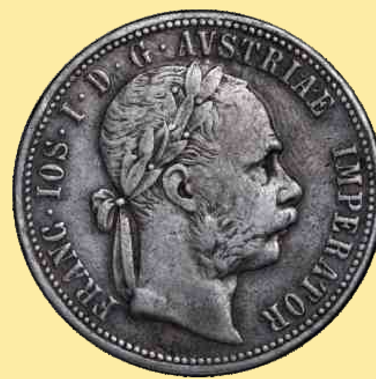
Vedení dolu obdarovalo havíře dne 14. 9. 1875 jako projev uznání za jimi vykonané dílo tzv. příbramským pamětním stříbrným zlatníkem. Na lici platidla je portrét císaře Františka Josefa I., na rubu mince poprvé použitý česko-německý text: „Upomínka na dosaženou kolmou hloubku 1 000 m, Příbram 1875“.